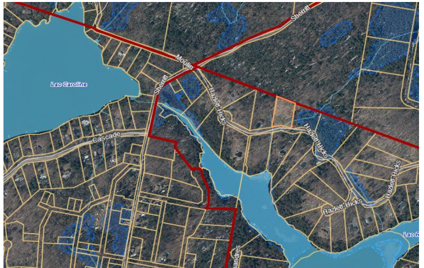
Localisation du PPCMOI – Lot 5 081 112, rue Hazlett-Hicks (zone VI-10)

CETTE RÉOLUTION DE PPCMOI VISE à autoriser l'aménagement d'une allée d'accès à 10 mètres d'un cours d'eau par une réduction de la profondeur de la rive dérogeant ainsi à la définition de celle-ci et à l'article 153 du règlement de zonage 214. La demande vise également à autoriser la construction d'une entrée charretière avant le dépôt d'une demande de permis pour une nouvelle résidence (dérogation à l'article 98 du règlement de zonage no 214).